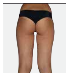
PO 10 OŠETŘENÍCH